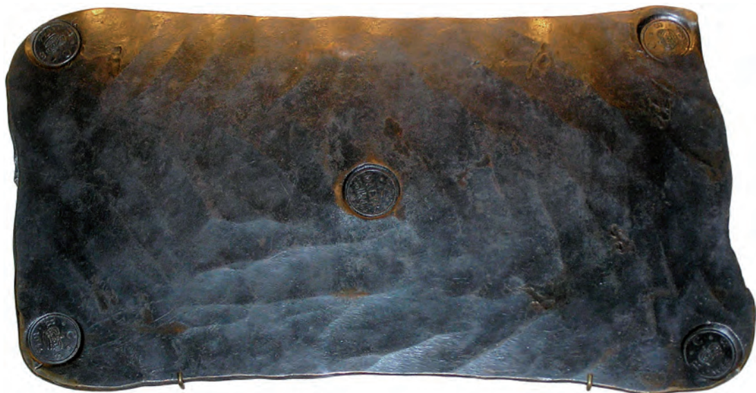
Bild 2. 10-dalerplåt ur Avesta myntmuseums samlingar.