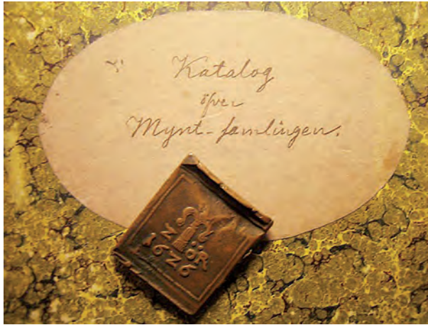
Bild 3. Detalj av framsidan till en egengjord myntkatalog med en klipping representativ för samlingens kopparmynt (Regionsmuseet i Kristianstad. Foto D. Carlberg).

efterlämnade Kallenberg ett antal förteckningar av olika slag. Dels finns fyra förteckningar över den egna samlingen från åren 1860, 1862, 1871 och 1895, de tre förra ordnade kronologiskt och i sjunkande valörordning, den senare med uppdelning mellan myntmetallslagen. En femte anteckningsbok innehåller noteringar om de inköp och försäljningar som gjordes genom åren. Slutligen finns dels en odaterad av Kallenberg utprättad förteckning över läroverkets samling, vilkens vårdare han onekligen var, dels en anteckningsbok över "gåfvor till Christianstads H. Elementarläroverks Mynt- och Medaljsamling Läsåret 1871/72 - 81/82" som titeletiketten uttrycker det. Av dessa bevarade sammanställningar får vi en bild av Kallenbergs samlargärning som kompletterar studiet av de numismatiska föremålen. Inköps- och försäljningsställena är särskilt intressanta och visar för oss vilken hängiven samlare han var. Vidare är hans egna myntpåsar tryfferade med uppgifter om sitt innehåll, fakta om valör, årtal, myntort etc. Utöver dessa noteringar finns på en försvarlig del anteckningar som rör objektets proveniens.