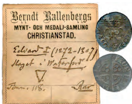
Bild 6. Engelska sterlingar från Vejbyfyndet från Skåne tillsammans med Kallenbergs förtryckta myntpåse (Regionsmuseet i Kristianstad. Foto C.v. Heijne).

präglades i England under Edward III (1327-77) 8 . De engelska mynten åtnjöt ett högt anseende i Danmark såväl som i hela Europa och från och med 1290-talet förekommer allt oftare omnämnande av engelska sterlingar i skriftliga dokument som testamenten och år 1318 i Erik Menveds tullsatser. Den franska gros turnois infördes i Frankrike 1266 av Louis IX (1266-1270). Den kom att präglas fram till 1300-talets slut. I Vejbyfyndet finns enligt Kallenbergs anteckningar gros turnois präglade under Philip IV (1285-1314) med tillnamnet den sköne. Gros turnois har i Norden framförallt påträffats inom det gamla danska området. Däremot är fynden få från det svenska fastlandet 9 .