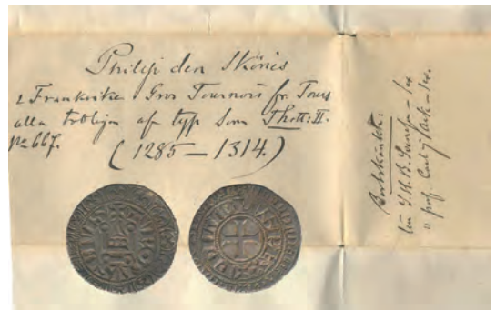
Bild 5. Gros turnois från Vejbyfyndet från Skåne tillsammans med Kallenbergs handskrivna myntkuvert (Regionsmuseet i Kristianstad. Foto C. v. Heijne).