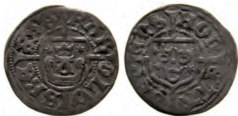
Hybrid 5:4/5. "Åbo-örtug". Hybrid mellan Holmberg 5:4 och 5:5, Rbg 5g. Troligen präglad i Raseborg, efter januari 1465.

En anmärkningsvärd observation är att hybriderna mellan 5:2 och 5:3 inte existerar alls i det bevarade materialet! Ännu mera märkligt blir detta förhållande när man noterar att flera stamper av typen 5:3 (två åtsides- och två fransidesstamper) faktiskt är omgraverade 5:2-stamper, där man lagt till stjärnorna. Här har man alltså verkligen ansträngt sig för att markera en förändring av något slag och för att helt undvika hybrider. Vi kan vara övertygade om att förändringen var något av stor betydelse. Annars skulle man ju bara ha gjort som vid de föregående och efterföljande typbytena – nämligen förbrukat existerande stamper och tillåtit hybrider.