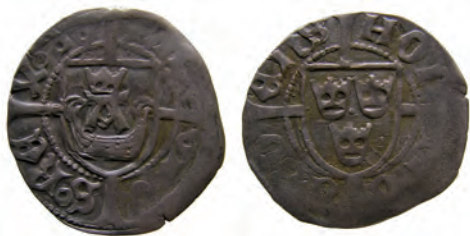
Hybrid 5:1/2. Åbo-örtug. Hybrid mellan Holmberg 5:1 och 5:2, Rbg 5b. Det finns även ett känt exemplar på en hybrid 5:2/1. Präglad september 1453 – februari 1457.