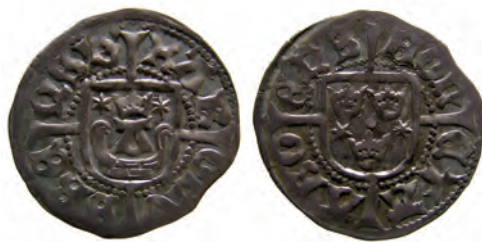
Typ 5:4. "Åbo-örtug". Rbg 5f. Troligen präglad i Raseborg, efter januari 1465.