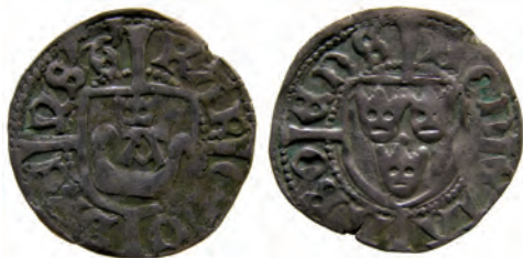
Typ 5:2. Åbo-örtug. Rbg 5c. Just denna stampkombination, 1012A)(2052, av typen 5:2 hör till kedja H och är därmed slagen i Åbo under Karls korta andra period som svensk kung, okt 1464 – jan 1465. Stampkombinationen är tidigare publicerad.