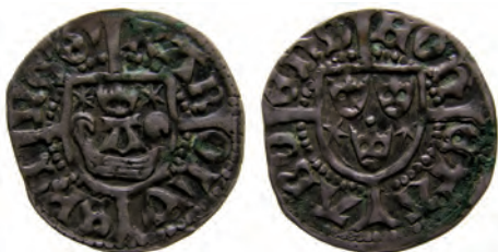
Typ 5:3. "Åbo-örtug". Rbg 5d. Troligen präglad i Raseborg, efter januari 1465.