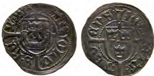
Typ 5:1. Åbo-örtug. Rbg 5a. Präglad september 1453 – februari 1457. Detta är den äldsta Åbo-typen.

Samtliga mynt avbildas i skala 150%.