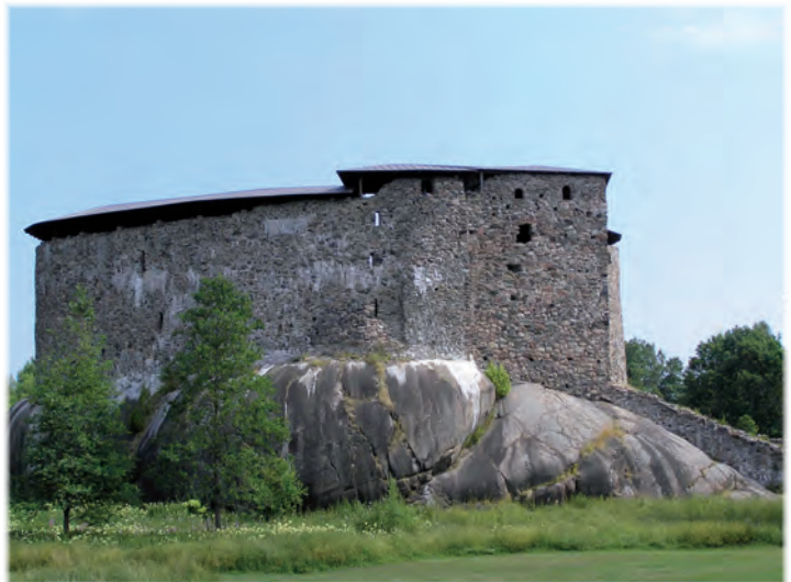
Fig 2. Raseborgs borgruin. Uppförd på 1370-talet av Bo Jonsson Grip. Här residerade kung Karl Knutsson Bonde under sin exil i Finland 1465-1467.

Hans andra period som svensk kung blir dock problematisk och kortvarig. Han lyckas t.ex. inte få kontroll över Stockholms slott, och redan i januari 1465 tvingas han åter lämna landet. Denna gång dock med betydligt bättre villkor – han får behålla sin kungatitel (!), och han får betydande förläningar i Finland. Han bosätter sig på Raseborgs slott i sydvästra Finland (Fig 2), som vid denna tid var en av Finlands starkaste borgar. Bevarade handlingar visar att Karl initialt hade vissa ekonomiska problem, men att hans ekonomi stärktes under hans vistelse i Finland. I september 1467 återkallar man åter Karl till Stockholm, och han blir för tredje gången kung över hela Sverige. Denna titel innehar han sedan till sin död 15 maj 1470.