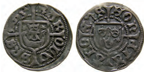
Typ 5:5. "Åbo-örtug". Rbg 5h. Troligen präglad i Raseborg, efter januari 1465. Detta är den yngsta "Åbo-typen".

Denna sammanställning av typer i kronologisk ordning ger upphov till några intressanta observationer. Dels kan man konstatera att man genom att i tur och ordning ändra ett antal element i designen skapar nya typer. Från en starttyp med (i) ringar i omskriften på båda sidor, (ii) inga stjärnor i sköldarna, (iii) två kronbågsöppningar i alla kronor, och (iv) trubbiga sköldar , så slutar Karl Knutssons Åbo-myntning med en typ som på båda sidor har (i) inga ringar i omskrifterna, (ii) stjärnor i sköldarna, (iii) fyra kronbågsöppningar , samt (iv) spetsiga sköldar . Detta innebär att vi har exakt fem huvudtyper (Här benämnda 5:1, 5:2, 5:3, 5:4 och 5:5). Dessa svarar mot Rbg 5a, 5c, 5d, 5f, 5h, där ändringarna successivt genomförts på myntens båda sidor. Som en bieffekt av dessa typändringar finns sedan ett antal "övergångsformer" eller hybrider mellan dessa: Rbg 5b är alltså hybriden mellan 5:1 och 5:2; Rbg 5e är hybriden mellan 5:3 och 5:4 och slutligen är Rbg 5g hybriden mellan 5:4 och 5:5. På hybriderna har den ena sidan stilelementen från den äldre typen och på den andra sidan stilelementen från den yngre typen. Med endast ett undantag så har de nya stilelementen först introduceras på myntens frånsida, vilket tyder på att typbytena planerats noggrant och strikt genomförts. Uppenbarligen hade man god ordning på sin myntning under denna period.