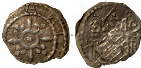
Fig. 2. Gotländskt pax porta-mynt. Ur fynd från Öland, Persnäs sn, Gunnarstorp (SHM 17771). 0,17 g. Skala 3:1.