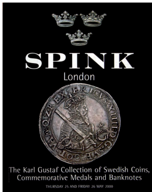
Bild 2. Spinks auktionskatalog över The Karl Gustaf Collection of Swedish Coins, Commemorative medals and Banknotes från försommaren 2000.

Auktionen betingades av spännande och oväntade förutsättningar. Katalogiseringen blev ambitiöst genomförd, med angivande av omskrifter och interpunktioner rörande de äldre mynten. Nästan samtliga äldre objekt avbildades vilket är