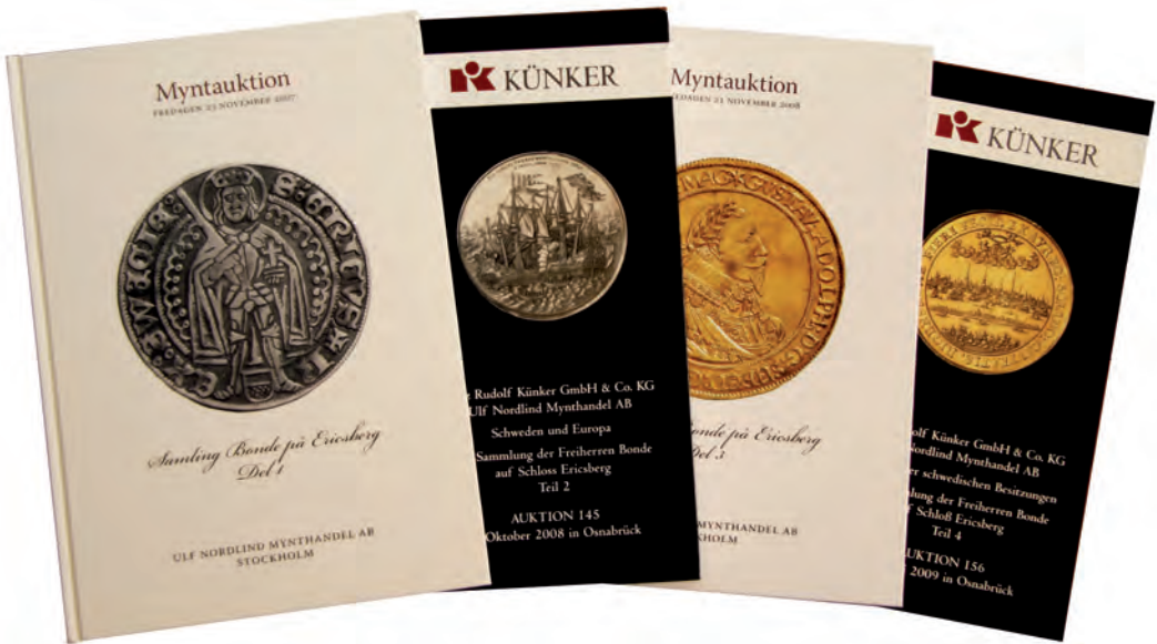
Bild 1. Bondesamlingens fyra första auktionskataloger.

teter som sedan den första auktionen i november 2007 med ungefär två auktioners takt per år nu fördelas på nya ägare.