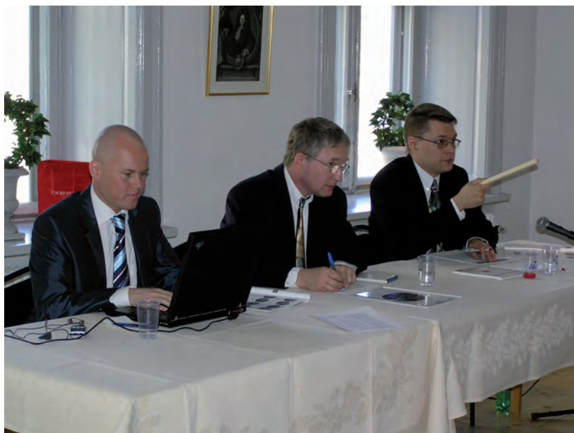
Bild 4. Ett utsnitt av podiet från Aurums premiärauktion 2005-05-15.