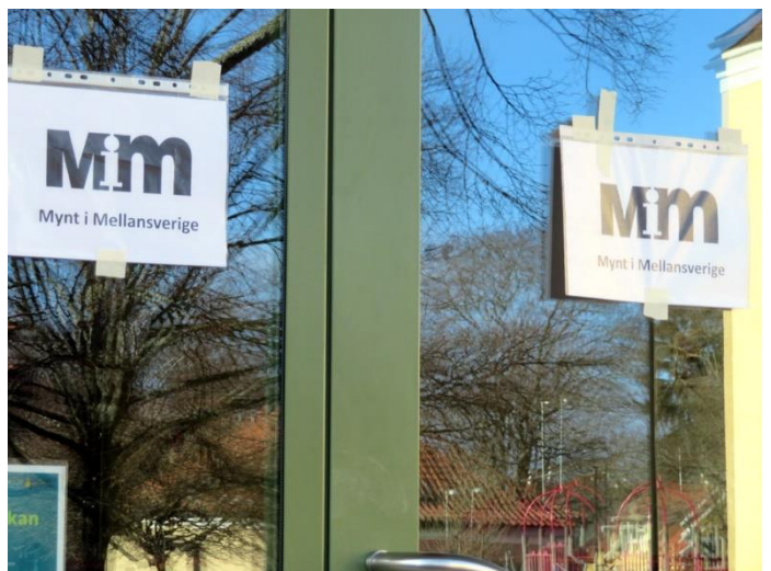
MiM-mötet i Sverkerskolans matsal