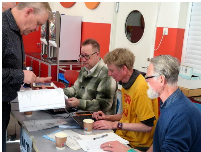
Auktionen avslutad – betalning av köpta objekt