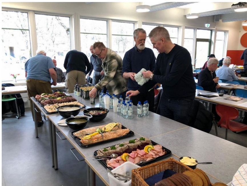
Mums i Mellansverige