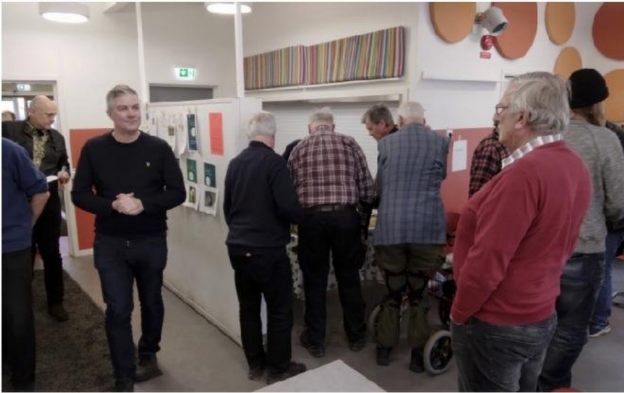
Varför skockas karlarna här då? ....