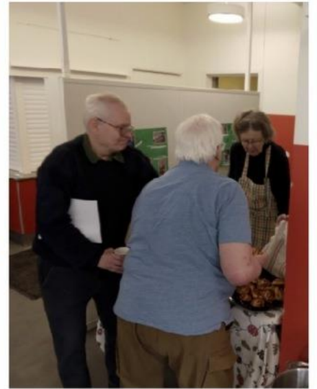
Fika och en synnerligen trevlig dam som serverar det, förstås!