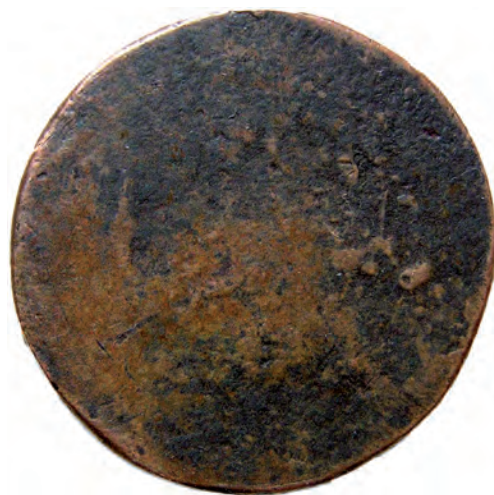
Bild 1. Åtsida: UPSALA STAD ANNO 1699. D.F. Frånsida: Opräglad. Diameter: 25 mm. Vikt: 6.41 gr.