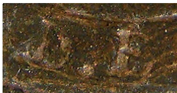
Bild 2. Detalj från åtsidan med signaturen D.F