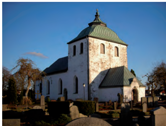
Fig 1. Gråmanstorps kyrka i Skåne

Att man inte har följt anvisningarna från Riksantikvarieämbetet visar fyndet klart. Kanske har kyrkfynden inte den plats i arkeologmedvetandet här i Skåne som kyrkfynden motiverar, eftersom det vid senare kyrkorestaureringar på 2000-talet inte ansetts motiverat att sälla jorden trots omfattande arbeten inne i kyrkorna (här är det främst Össjö kyrka som avses). Fyndet i Gråmanstorp visar också att en viss försiktighet alltid måste iaktas vid en statistisk bearbetning av fyndmaterial från ett särskilt landskap.