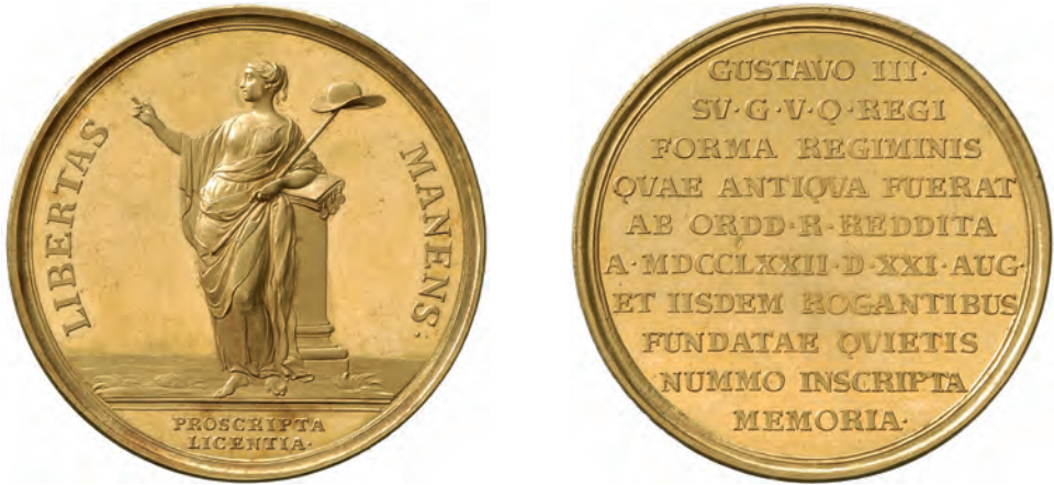
Bild 7. Konungens nya regeringsform 1772, en av de fem guldmedaljer som diskuterades i affärens slutskede. Den såldes på Ahlströms auktion 35 som utrop 497. De övriga guldmedaljerna var sannolikt Ahl. 35:492, Ahl. 35:493 och Ahl. 35:495. Möjligen kan medaljen över Lovisa Ulrika vara utrop Ahl. 35:494.