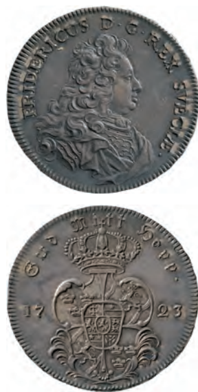
Bild 2. Fredrik I, Riksdaler 1723. Även kallat "Krellmynt". Ett av de fina mynt som ingick i köpet från Capitol Coin Company's lista 68:85 (Ahl. 35:348).

Efter detta skrev han en lång önskelista med mynt från Gustav Vasa och framåt. På en tidigare fråga från Friedman huruvida Ekström var intresserad av kopparmynt svarade Ekström att han naturligt-