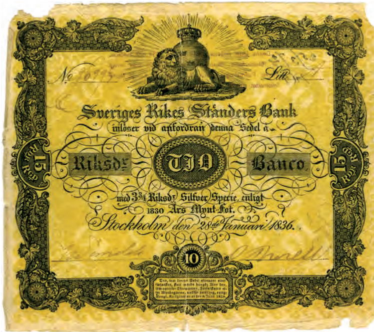
Fig 6. 10 riksdaler banco = 3\frac{3}{4} riksdaler silverspecie = 15 riksdaler riksgälds. "Klart ljusgul", ca 165x140 mm. Serienummer och seriebokstav är handskrivna på detta exemplar från 1836. Benämningar: små gulingar (1841, 1857); gula tior (1845). Från 11 maj 1836 (SFS 1836:8).