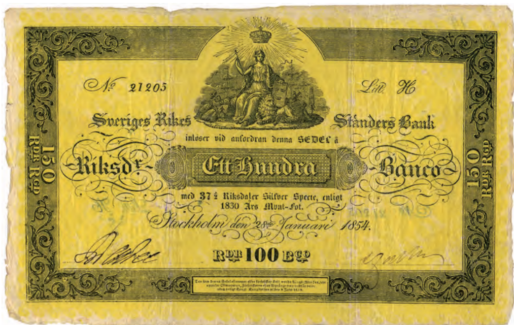
Fig 9. 100 riksdaler banco = 37 ½ riksdaler silverspecie = 150 riksdaler riksgälds. "Klart ljusgul", ca 225x140 mm. Serienummer och seriebokstav är tryckta på detta exemplar från 1854. Benämningar: stora gula (1844); gulfink (1847); gul svensk banksoschal (1856). Från 1 april 1836 (SFS 1835:5).