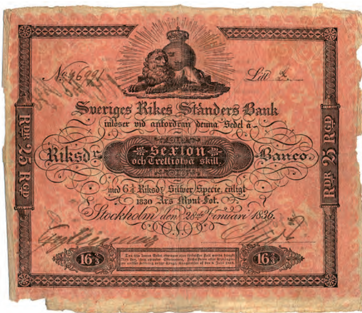
Fig 7. 16 riksdaler 32 skillingar banco = 6\frac{1}{4} riksdaler silverspecie = 25 riksdaler riksgälds. "Dunkelt ljusröd, närmade sig till tegel=couleur", ca 165x140 mm. Serienummer och seriebokstav är handskrivna på detta exemplar från 1836. Benämningar: rödbeta (1838); tjugufemman (1845); rödhake. Från 1 april 1836 (SFS 1835:5).