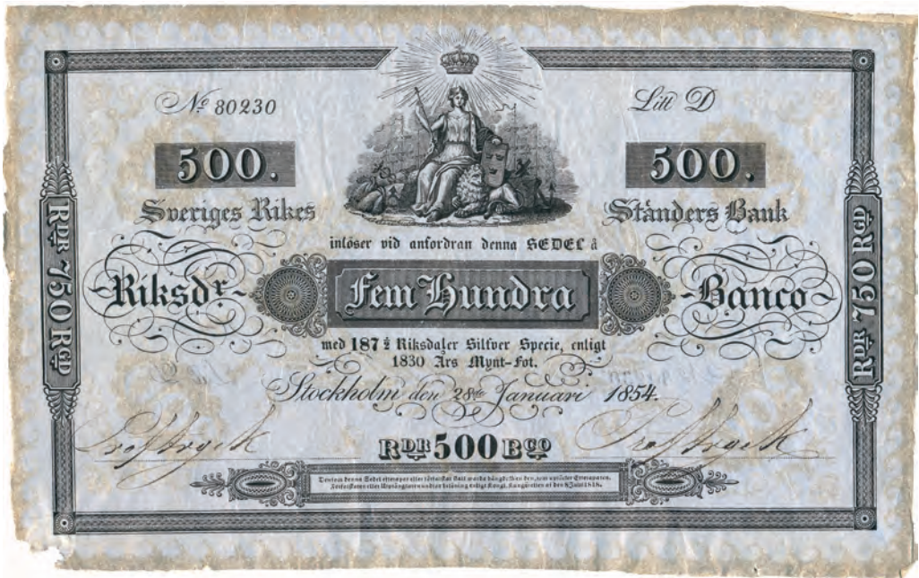
Fig 10. 500 riksdaler banco = 187 ½ riksdaler silverspecie = 750 riksdaler riksgälds. "Ljust blåhvitt eller perl=couleur", ca 225x140 mm. Serienummer och seriebokstav är tryckta på detta exemplar från 1854. Benämningar: blå fågel (1846); Fågel Blå (1847). Från 1 april 1836 (SFS 1835:5).