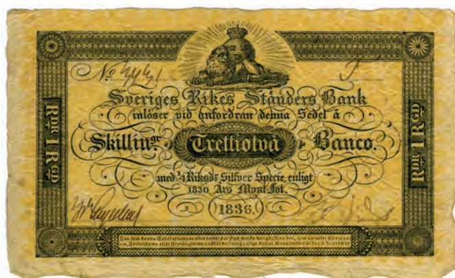
Fig 3. 32 skillingar banko = \frac{1}{4} riksdaler silverspecie = 1 riksdaler riksgälds. "Dunkelt gul", ca 145x90 mm. Serienummer och seriebokstav är handskrivna på detta exemplar från 1836. Benämningar: kanariefågel (1843, 1852); gulling (1875); guldfink (1875); riksgäldsetta (1864). Från 1 januari 1837 (SFS 1836:35).

"... [att] människorna alltid älskat och fortfarande älskar pengar. Det man älskar, slösar man smeknamn på".