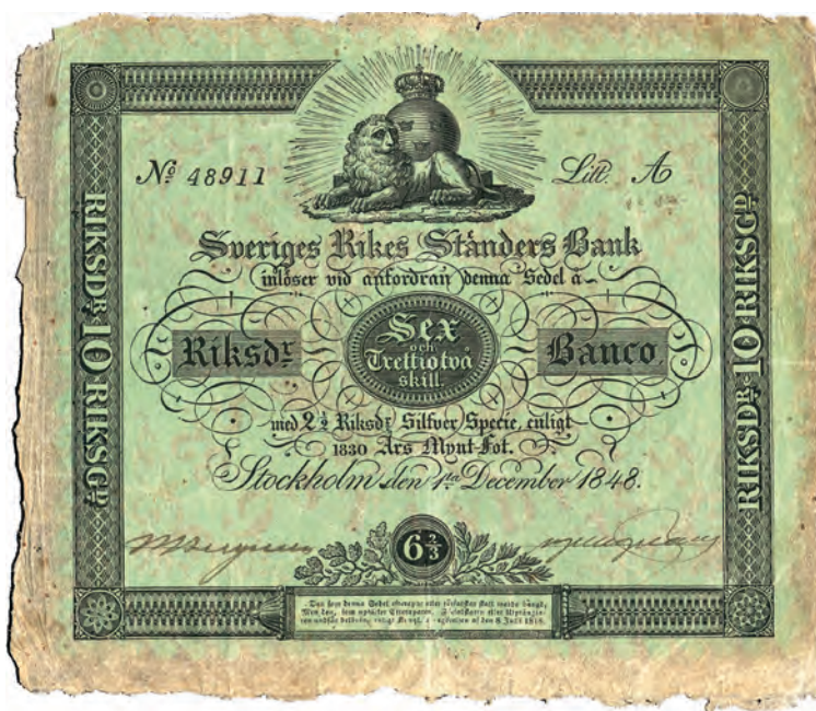
Fig 5. 6 riksdaler 32 skillingar banco = 2\frac{1}{2} riksdaler silverspecie = 10 riksdaler riksgälds. "Ljust grön", ca 165x140 mm. Serienummer och seriebokstav är tryckta på detta exemplar från 1848. Benämningar: gröna tior (1845); tia (1856); grönsiska (1856, 1865). Från 1 december 1835 (SFS 1835:60).