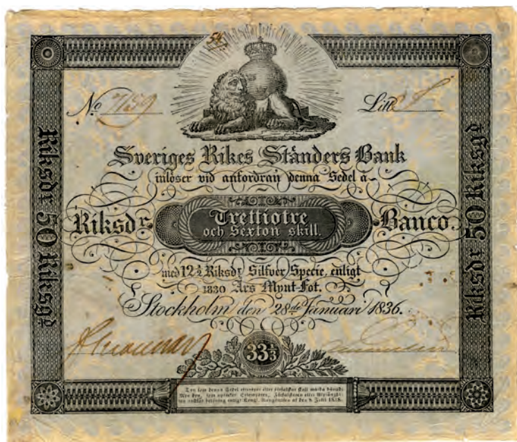
Fig 8. 33 riksdaler 16 skillingar banco = 12 ½ riksdaler silverspecie = 50 riksdaler riksgälds. "Ljust blåhwitt eller perl=couleur", ca 165x140 mm. Serienummer och seriebokstav är handskrivna på detta exemplar från 1836. Benämningar: liten lömmördare (1838); femtiör (1845). Från 1 april 1836 (SFS 1835:5).