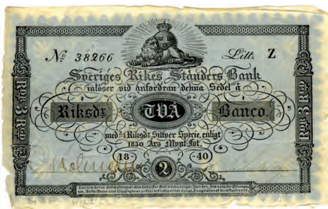
Fig 4. 2 riksdaler banco = \frac{3}{4} riksdaler silverspecie = 3 riksdaler riksgälds. "Ljust blåhvit, eller perlcouleur", ca 145x90. Serienummer och seriebokstav är tryckta på detta exemplar från 1840. Benämning: blå tvåa banco (1882). Från 1 januari 1837 (SFS 1836:35).