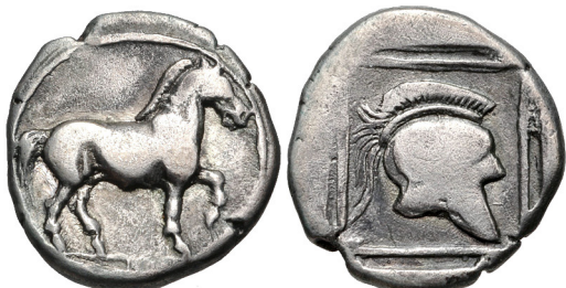
Fig. 2. Perdikkas II, AR tetrobol, 13.5 mm, 2.04 g.