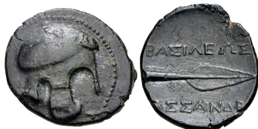
Fig. 17. Kassandros, AE 19, 19 mm, 3.53 g.