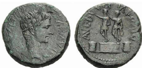
Fig. 31. Kejsar Augustus, Romerskt provinsmynt från Filippi, AE 23, 23 mm, 11.75 g.

släktingen Lepidus Paullus ut en silverdenar år 62 med en frånsida visande en makedonsk trofé med Aemilius Paullus på höger sida och fångarna Perseus med två barn på den vänstra, Fig. 28.