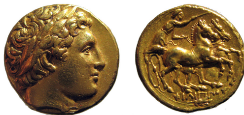
Fig. 6. Filip II, AV stater, 18 mm, 8.59 g.

I Fig. 6 visas en guldstater med Apollon, Delfis speciella gudomlighet på åtsidan (Filip II blev Delfis beskyddare år 346 efter besegrandet av fokierna) och hästekipaget, som vann olympiska spelen 356, på frånsidan. Silvertetradrachmen i Fig. 7 har på åtsidan ett porträtt av den högsta gudomligheten Zeus, liknande Phidias Zeusstaty i Olympia, och på frånsidan en ryttare med palmkvist, även det ett tecken på Philips framgång i de olympiska spelen. Dessa mynt blev vitt spridda och populära i Grekland, vilket bidrog till acceptansen av Filip II som grekisk ledare.