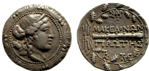
Fig. 29. Amphipolis, Första regionen, AR tetradrachm, 29 mm, 16.46 g.