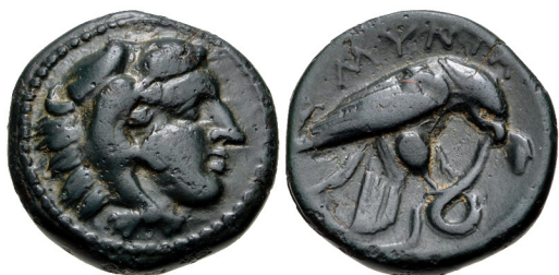
Fig. 5. Amyntas III, AE tetrachalkon, 16 mm, 3.92 g.

Under perserkriget var Alexander I (498 – 454) en akemenidisk vasall, en roll som han utnyttjade för personlig vinning, och efter persernas förlust och tillbakadragande år 479, utvecklade till ett nära samarbete med grekerna. Han tilldelades postumt titeln Alexander I Philhellene (greklandsvännen). Redan vid de olympiska spelen år 504 tilläts han att medverka med hänvisning till sitt ursprung från Herkules och Argos, även om Makedonien på den tiden fortfarande betraktades som en barbarisk stat.