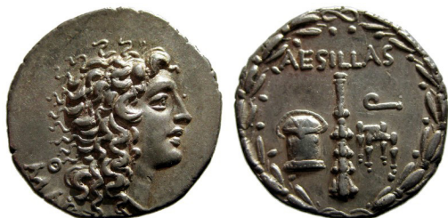
Fig. 30. Thessaloniki, Romersk provins, Aesillas, AR tetradrachm, 30 mm, 16.52 g.