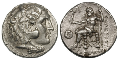
Fig. 21. Seleukos I Nikator, AR tetradrachm, 26 mm, 17.09 g.

Lysimachos (306 – 281) var nära vän till Alexander den Store och hans livvakt under det persiska fälttåget. Efter Alexanders död år 323 blev han ståthållare i Thrakien, en uppgift inte helt utan stridigheter. Han grundade staden Lysimachia. I likhet med Antigonos antog han kungatitel år 306. Han deltog i alliansen av diadochoi i kriget mot Antigonos, som besegrades i slaget vid Ipsos år 301, varvid Lysimachos erhöi en stor del av Mindre Asien. Han råkade dock i fiendskap med sina forna bundsförvanter och stupade i krig mot Seleukos år 281, vilket medförde att det thrakiska kungariket upphörde. En av Lysimachos generaler, Filetairos, blev kung år 282 och grundade attaliddynastin med Pergamon som huvudstad.