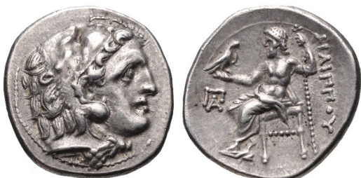
Fig. 13. Filip III, AR drachm, 17 mm, 4.23 g.

ΑΛΕΞΑΝΔΡΟΥ ΒΑΣΙΛΕΩΣ (kung Alexander) – ett typexempel på mynt med makt- och segeranspråk. Även tetradrachmen i Fig 11 hänvisar till tunga maktanspråk – hjälten Herkules klädd i lejonskinn på åtsidan och guden Zeus sittande på en tron med örn och spjut på frånsidan.