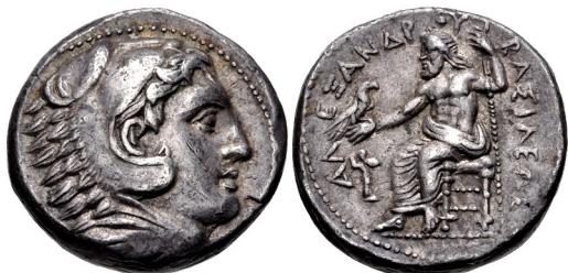
Fig. 12. Filip III, AR tetradrachm, 25 mm, 17.21 g.