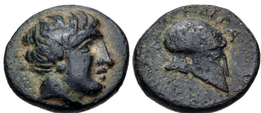
Fig. 4. Amyntas II, AE dichalkon, 13.5 mm, 2.19 g.