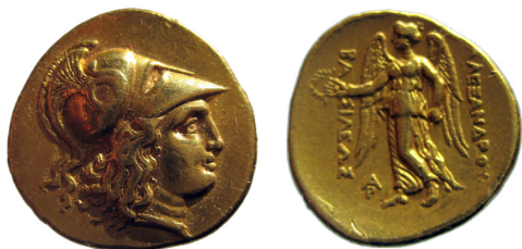
Fig. 10. Alexander III, AV stater, 19 mm, 8.57 g.

Guldstatern i Fig. 10 uppvisar på åtsidan gudinnan Athena med korintisk hjälm och på frånsidan segergudinnan Nike hållande krans och skeppsmast, samt med inskriptionen