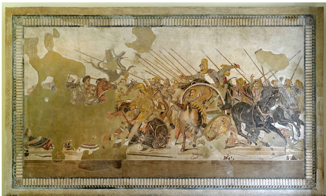
Fig. 9. Slaget vid Issos år 333 med Alexander till häst till vänster och Dareios III i stridsvagn till höger.

Framgent tornade dock större problem upp sig för Alexander. Den persiske kungen Dareios III, med en till antalet soldater helt överlägsen armé, mobiliserade i sydöstra "Turkiet". I slaget vid Issos år 333 lyckades en mer taktisk Alexander besegra den persiska armén varvid Darios själv tog till flykten. Det för den fortsatta utvecklingen avgörande slaget i Issos återges ovan i Fig. 9, i den berömda mosaiktavlan från Pompei, som visas i Neapels arkeologiska museum.