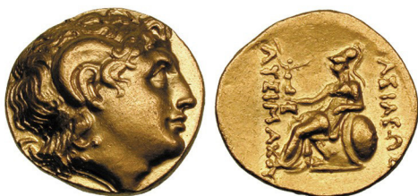
Fig. 18. Lysimachos, AV stater, 19 mm, 8.52 g.