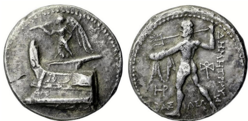
Fig. 22. Demetrios I Poliorketes, AR tetradrachm, 28 mm, 16.89 g.