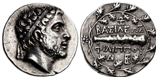
Fig. 26. Filip V, AR didrachm, 23 mm, 8.39 g.

Perseus (179 – 168) kom att bli den sista makedonske regenten. Trots varierande framgångar i relationen med romarna under den tioåriga regeringsperioden slutade det dock med en förlust mot romarna, ledda av generalen Lucius Aemilius Paullus i slaget vid Pydna år 168. Perseus med familj tillfångatogs och fördes av Paullus till Rom för att uppvisas där under det kommande segertåget. Efter två år i romersk fångenskap avlivades Perseus. För att hedra minnet av Aemilius Paullus seger över makedonierna gav