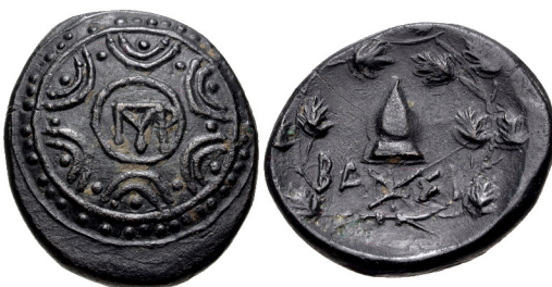
Fig. 23. Pyrrhos, AE 17, 16.5 mm, 4.82 g.