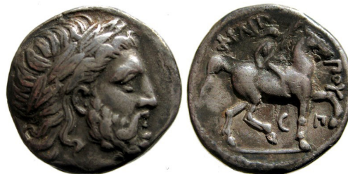
Fig. 7. Filip II, AR tetradrachm, 24 mm, 13.94 g.