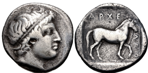
Fig. 3. Archelaos I, AR stater, 23 mm, 10.14 g.