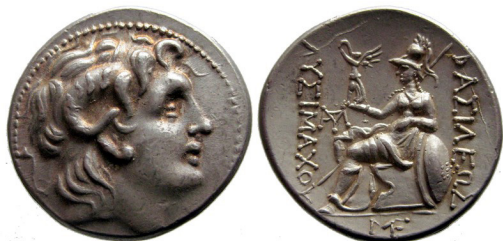
Fig. 19. Lysimachos, AR tetradrachm, 30 mm, 17.09 g.