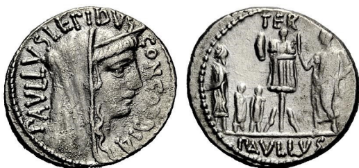
Fig. 28. L. Aemilius Lepidus Paullus, AR denar, 18.5 mm, 3.96 g.