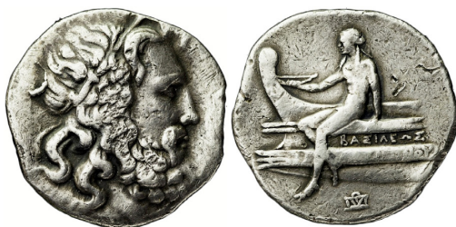
Fig. 25. Antigonos III Doseon, AR tetradrachm, 29 mm, 16.73 g.

vid Salamis vid Cyperns kust mot Ptolemaios I år 306. Åtsidan visar segergudinnan Nike på fören av ett skepp och frånsidan den anfallande havsguden Poseiden med treudd. Demetrios präglings av bronsmynt var även den storskalig.