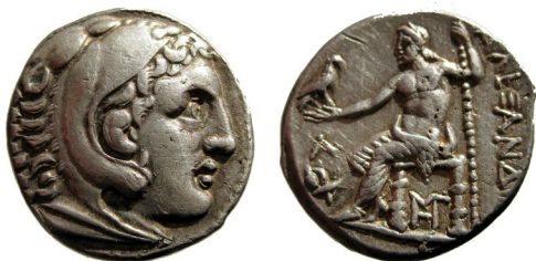
Fig. 11. Alexander III, AR tetradrachm, 25 mm, 17.21 g.