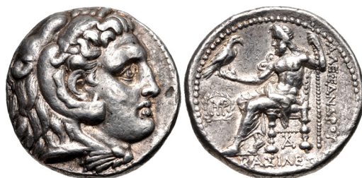
Fig. 15. Antigonos I Monofthalmos, AR tetradrachm, 25.5 mm, 17.03 g.

Antigonos I Monofthalmos hade utropat sig till kung år 306 som den förste av diadochierna . Han grundade antigoniddynastin, som kom att leda kungariket i Makedonien på grekiska fastlandet i mer än 100 år, även om han själv stupade vid slaget i Ipsos och hans son Demetrios I Poliorketes blev den förste makedonske regenten i dynastin. Myntet i Fig. 15 är präglat i Babylon år 315 – 311 av Antigonos I och är av sedvanlig alexandertyp.