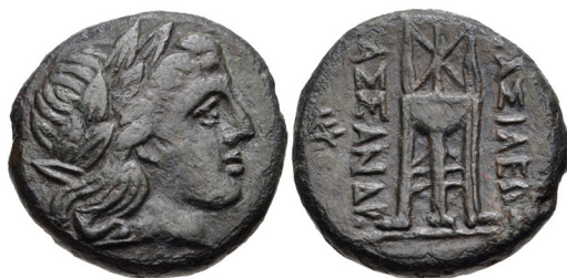
Fig. 16. Kassandros, AE 18, 18 mm, 6.43 g.

Myntet i Fig. 16 visar guden Apollon på åtsidan och en trefot på frånsidan, bägge motiven med hänvisning till staden Delfi, medan myntet i Fig. 17 uppvisar mer krigiska attribut – en chalkidisk hjälm på åtsidan och en spjutspets på frånsidan – bägge mynten med texten ΒΑΣΙΛΕΩΣ ΚΑΣΣΑΝΔΡΟΥ.