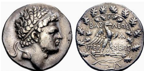
Fig. 27. Perseus, AR tetradrachm, 32 mm, 14.94 g.