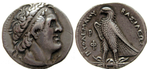
Fig. 20. Ptolemaios I Soter, AR tetradrachm, 26 mm, 14.20 g.