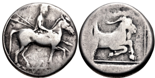
Fig. 1. Alexander I, AR tetradrachm, 24.5 mm, 12.40 g.