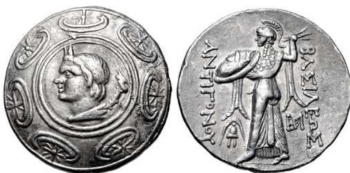
Fig. 24. Antigonos II Gonatas, AR tetradrachm, 29 mm, 16.90 g.