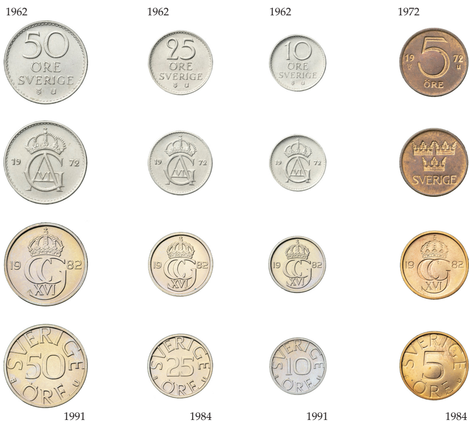
Fig. 1. Gustaf VI Adolfs senare öresmynt och Carl XVI Gustafs öresmynt.

direktör Ulvfot den realistiska bedömningen att det långa myntåret 1973 skulle övergå i 1975. Efter tävling - och komplikationer - ja, då försvann ytterligare ett år. Nu till öresmynten: