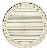
Fig. 10. 2009 års frånsida.

2009 fick alla enkronor en annan valörsida, till 200-årsminnet av Sveriges och Finlands skiljande. Det är unikt att en hel årgång vikts åt ett jubileum. Konstnären Annie Winblad Jakubowski tecknade de upptill och nedtill allt grövre horisontella strecken och dikticitatet i omskriften. Havet förenade och skilde, i historia och liv. Tankar kunde skapas om himmel och hav mot horisont, men också bryggplask och sol mot synliga bottnar.