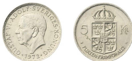
Fig. 3. Gustaf VI Adolfs mindre femkrona

och i jämförelse är Englunds enkrona ett slags uttryck för tidsandan. Samtidigt inte, för Englund skapar inte "Sverige" för någon tidsanda, utan för att få plats med ett större porträtt (med eller utan egen utblick mot antika grekiska kolleger). På valörsidan återkommer Lilla riksvapnet på porträttmynt efter 133 år (utom den internationella guld-carolinen 1868-72). Denna gång tecknas de tre kronorna på en rakare och smäckrare sköld. Bytet från stora till lilla riksvapnet har troligen inga andra skäl än visuella.