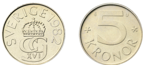
Fig. 5. Sigurd Perssons femkrona.

bestick för både lyx och funktion, metoder både hantverkets och industrins, i kyrkorna både silver och inredning, fri skulptur, kortare serier av vaser i skilda material och sopborste med skyffel i massproduktion, förutom uppbyggnad av inhemska organisationer på fältet och omfattande internationella engagemang.