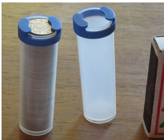
Fig. 6. Återanvändbara 10-öresrör som fyllda kunde användas som en femma.

med höjd haka i antydd halvprofil nästan romerskt på sin omgivning, och håret hade säkert lockat till parallell med "antika grekiska myntkonstnärer", om någon jury funnits på plats att registrera. Valörsidan placerade trompe l'oeil ("tröpp löj", bedra ögat) i den svenska mynthistorien. De tre kronorna är transparenta framför valörsiffran! (Legeringen 89 koppar, 5 aluminium, 5 zink, 1 tenn = 100.)