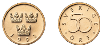
Fig. 8. 50-öringen från 1992.

1991 blev sista årtålet för tioöringen, och för femtioöringen i kopparnickel. Nästa års mindre femtioöring blev allra sist av öresmynt. Det formgavs av Bo Thorén - bland hans många verk för det offentliga fanns redan jubileumsmünt och några av Myntverkets egna medaljer. Tre kronor blev för sista gången en åtsidas rikssymbol. Legeringen var 97 procent koppar, 2 ½ procent zink och ½ procent tenn - alltså brons. Slutårtålet för den mindre 50-öringen blev, långt senare, 2009. Så, 2010 stadgade lagen att 49 öre skulle bli noll, 50 öre en krona!