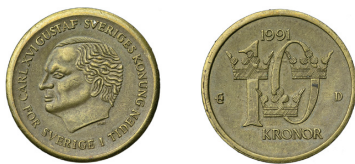
Fig. 11. S.k. "Kievtia".