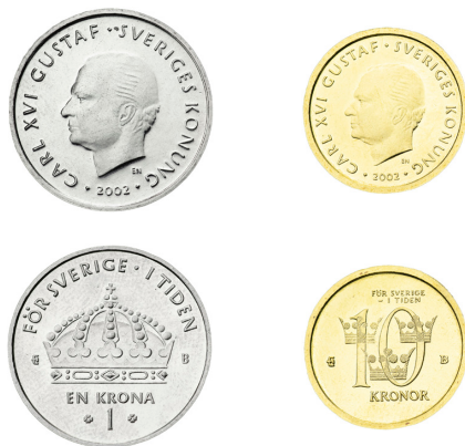
Fig. 9. Enkronan och tiokronan från 2001.