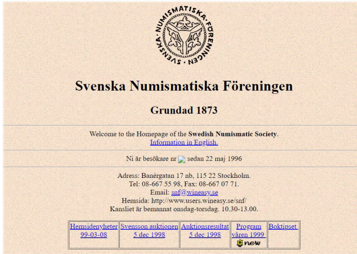
Fig. 3. SNF's hemsida skapad 1996 (bild från 1999).

var mynt.se (sic!). Antikören 7 (1998) var tidig med att presentera sina auktioner digitalt i form av nedladdningsbara pdf-listor.