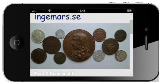
Fig. 2. Ingemars Myntsida avbildade i en iPhone. En symbolisk bild för att visa iPhone's betydelse för digitaliseringen.

Utvecklingen har snabbt gått från otympliga stationära datorer till bärbara datorer, läsplattor och de senaste åren smartphones. iPhone's intåg på marknaden 2007 kullkastade de mesta om vad vi visste om internet och digitalisering. Internetförsörjningen skedde till en början via modem som var uppkopplat mot telefonen, vi minns nog alla den uppkopplingston modemmet gav ifrån sig och hur seg kommunikationen var. Att internet var kopplat till telefonen medförde